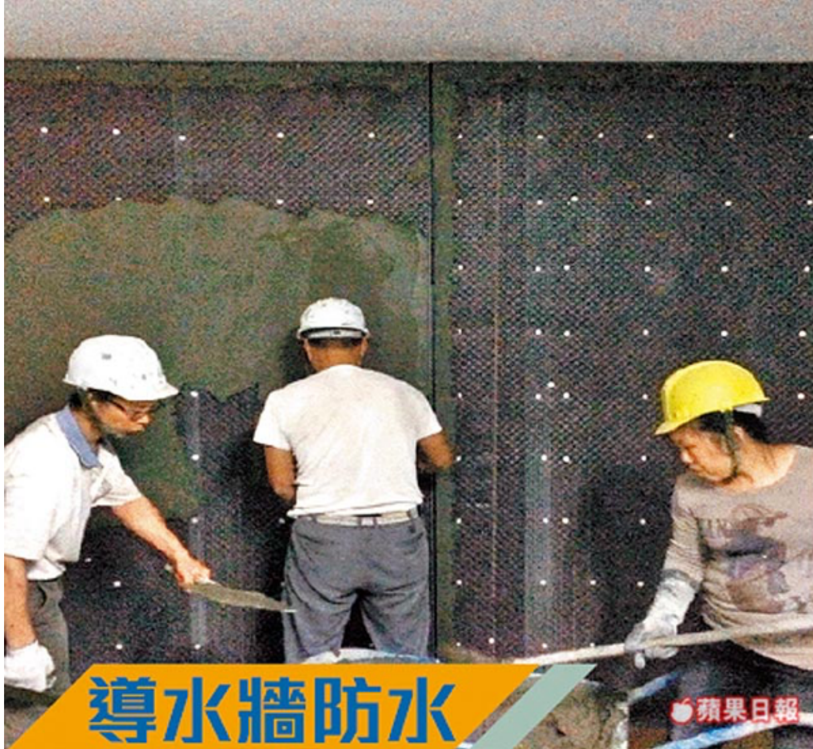
導水牆防水 導水牆系統適用於連續壁開挖的地下室，能確保滲流水導出。大信防水提供