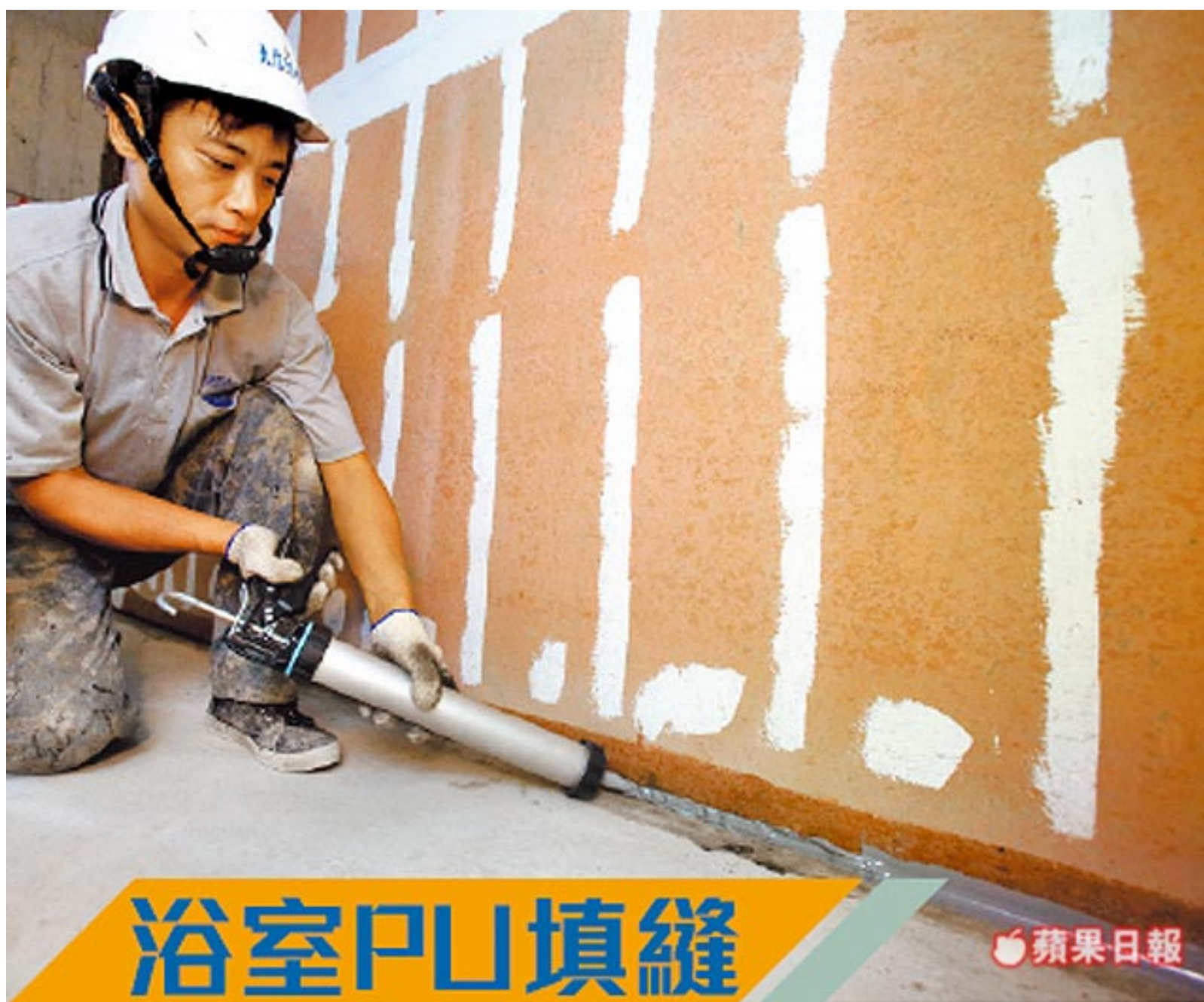
浴室PU填縫 單液PU可用於窗框、隔間縫隙，延展性、抗水性佳。