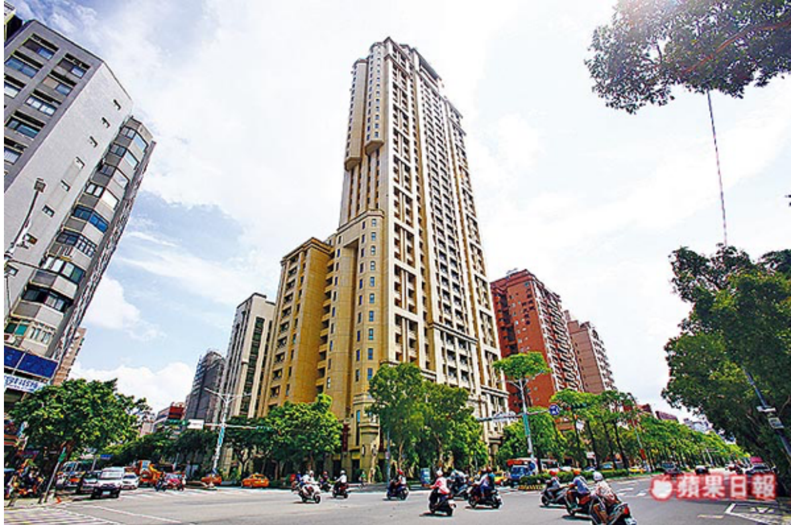
近年新成屋多採用新型防水材與工法，成本雖高，但更環保，防水時效也更長。